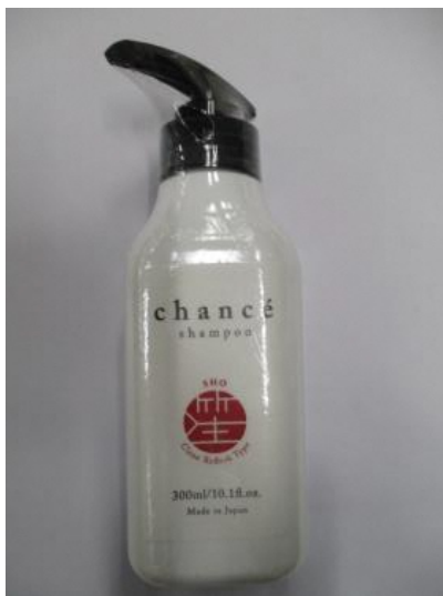
(12) シャンセ シャンプー 笙