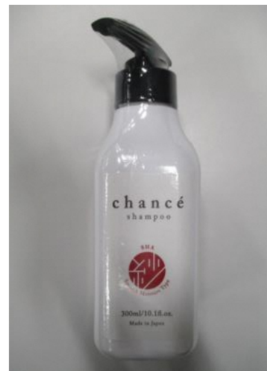
(13) シャンセ シャンプー 紗