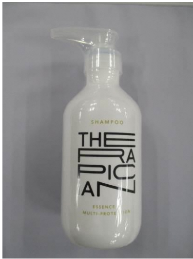
(10) Therapician Shampoo