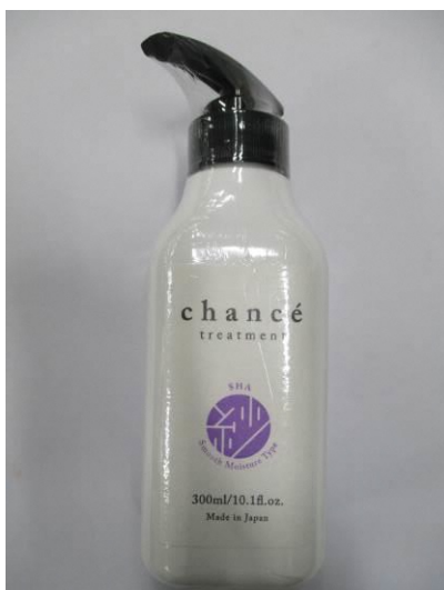
(14) シャンセ トリートメント 紗