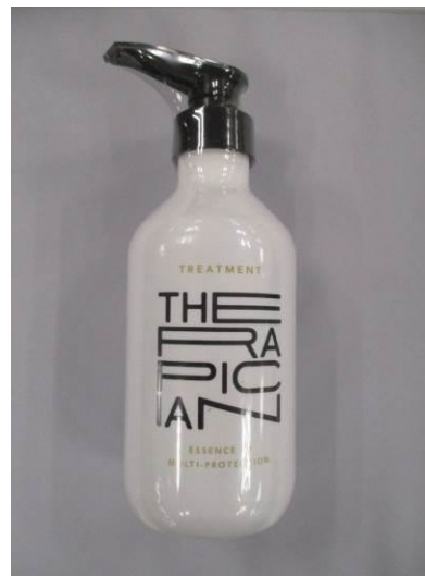
(11) Therapician Treatment