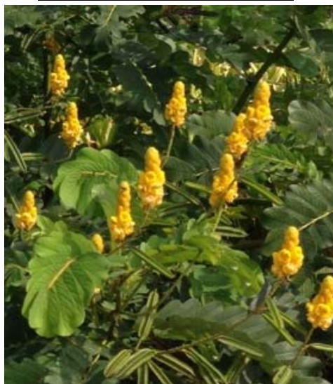
写真1. キャンドルブッシュ

センナの同属植物であり、小葉・葉軸・茎・花などにも、センノシドが含有されていることが報告されています。