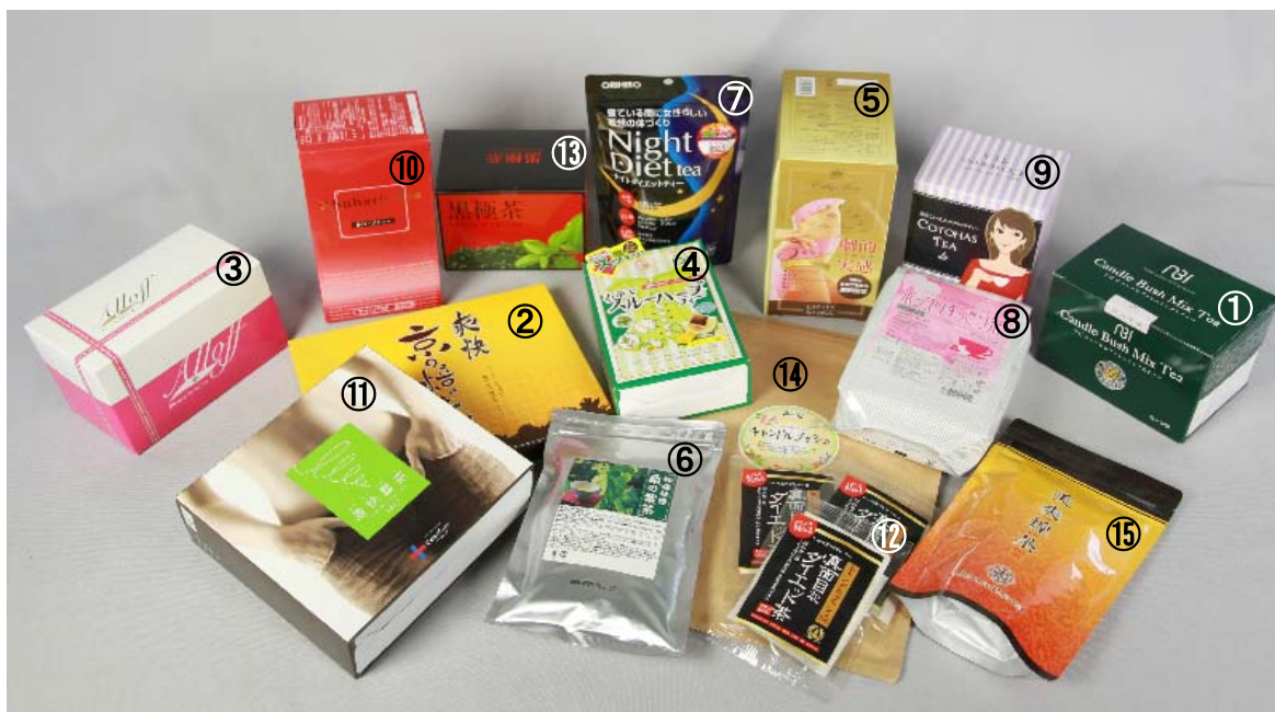
写真2. テスト対象銘柄

インターネットの通信販売及び大手ドラッグストア等で購入可能な銘柄を中心に、「キャンドルブッシュ」「ゴールデンキャンドル」「ハネセンナ」「カシヤ・アラタ」が原材料一覧の上位に記載されているティーバッグタイプの健康茶15銘柄をテスト対象としました(写真2、表1)。