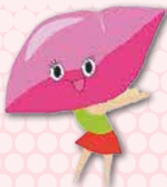
島根県肝炎対策キャラクター KZちゃん

肝がんの原因の6割以上が B型、C型肝炎ウイルスによるものです。 検査で早期発見し、治療することで 肝がんは予防できます。 まだ受けたことがない方は、 早めに検査を受けましょう！