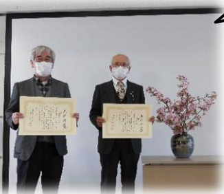
いきいき井尻健康会