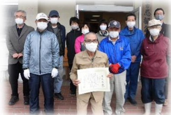
忌部花街道グループ