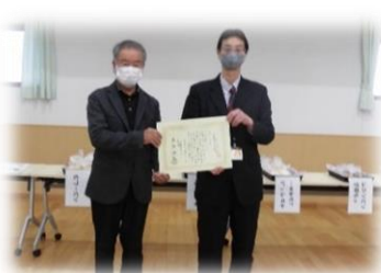
古江生きがい活動クラブ