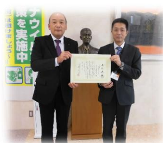
まるなか建設 株式会社