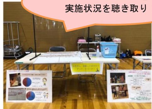
ボードアンケートで運動の 実施状況を聴き取り！