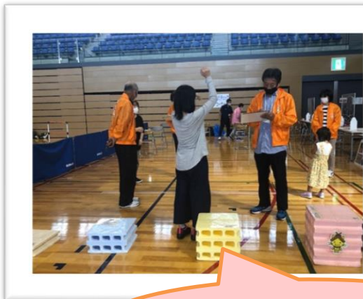
ロコモ椅子 (立ち上がりテスト)に挑戦！