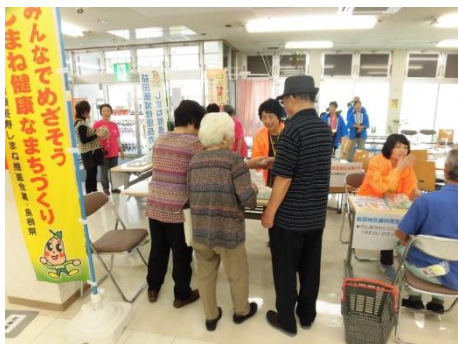
(↑益田地区栄養士会によるおいしい「だし」の試飲のコーナー)

益田圏域では、「まめなくんの健康広場」と題し、平成27年9月12日（土）に市内のショッピングセンターで実施し、圏域会議の構成団体によるおいしい「だし」の試飲、みそ汁の塩分測定や試飲のコーナーを設けたほか、来店者にうすあじレシピを配布し、「減塩」について呼びかけました。