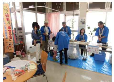
(↑島根県食品衛生協会益田支所による正しい手洗いのチェックのコーナー)