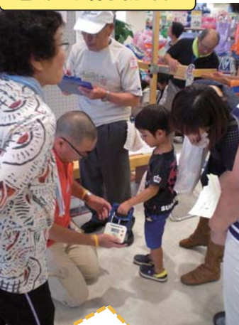
運動・介護予防部会

握力測定やコケやすさチェック、体組成計による体力年齢測定から、要介護状態にならないための注意点など、個別の運動アドバイスをしました。