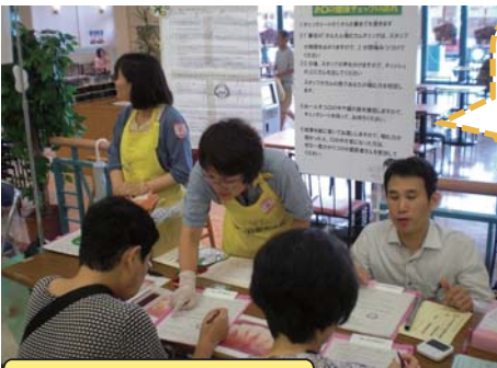
歯と口腔の健康部会

また、当日は40名の委員の方々スタッフが参加され、各構成団体が連携し、地域ぐるみでイベントを盛り上げることができました。