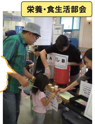
栄養・食生活部会

天然だしとインスタントだしの飲み比べは、意外と難しかったようです。トマトを使った料理の試食も大変好評でした。