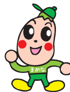
たばこ・アルコール対策部会

未成年者が飲酒してはいけない理由についてのパネルと、適正飲酒量モデルを展示しました。