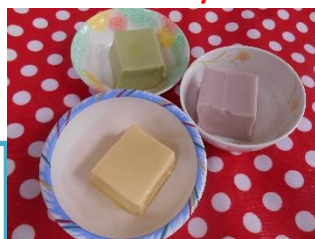
エンジョイゼリー