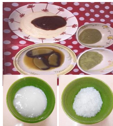
粥ゼリーカッター 粥ゼリー