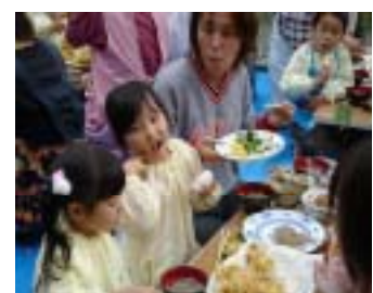
いただきま〜す!! みんなおかわりをたくさんして大きなお鍋がすぐに空になりました。