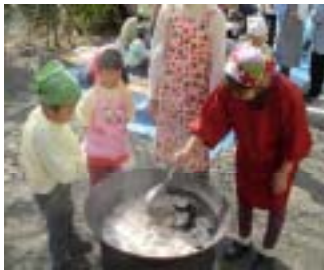
ソーダを加え丸めて形を整えてから茹でます。お鍋用に小さくちぎり野菜も自分で切りました。