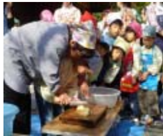
芋を茹で小さく切ります。