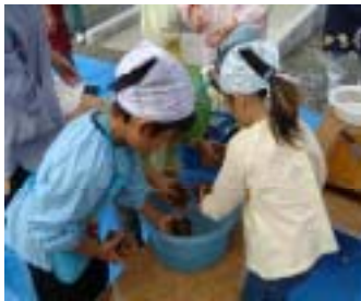
生のこんにゃく芋をたわしでゴシゴシ洗います。

当日は、金城町若生まなびや館で浜田ひかり保育所5歳児18名と保護者18名が参加し、若生地区の女性グループの指導で生芋からのこんにゃく作り、こんにゃくを使ったシシ鍋作り等を行いました。また、構成団体である中国四国農政局島根農政事務所からお米について学びました。ご協力いただいた皆様、ありがとうございました。