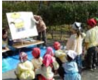
お鍋が煮えるまでパネルシアターでこんにゃく作りをおさらい。