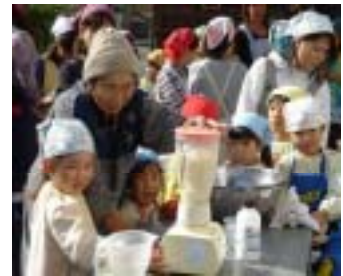
切った芋をミキサーでペースト状にします。