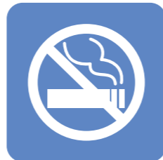
禁煙治療の 実施医療機関