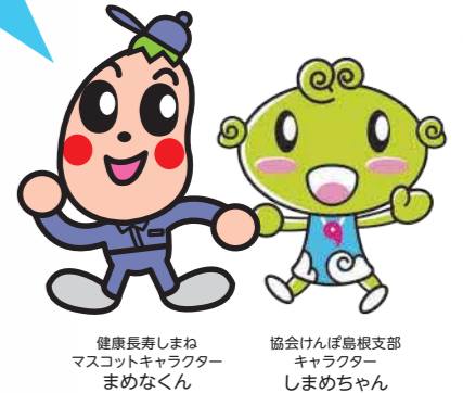
健康長寿しまね マスコットキャラクター まめなくん