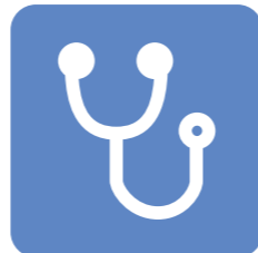
病気・メタボの 予防法

従業員の健康づくりに取り組んで しまね★まめなカンパニー & ヘルス・マネジメント認定制度 に登録しよう!