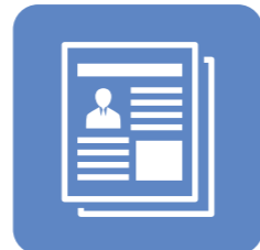
事業所の 取組事例