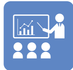
事業主セミナーの 開催予定