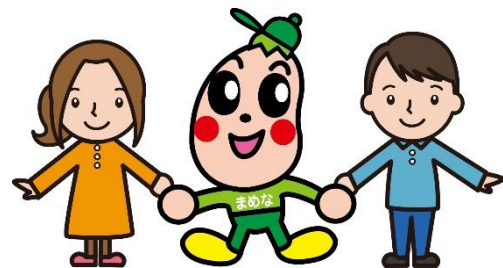
健康長寿しまねマスコットキャラクター「まめなくん」