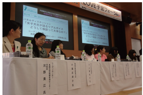
(パネルディスカッション)