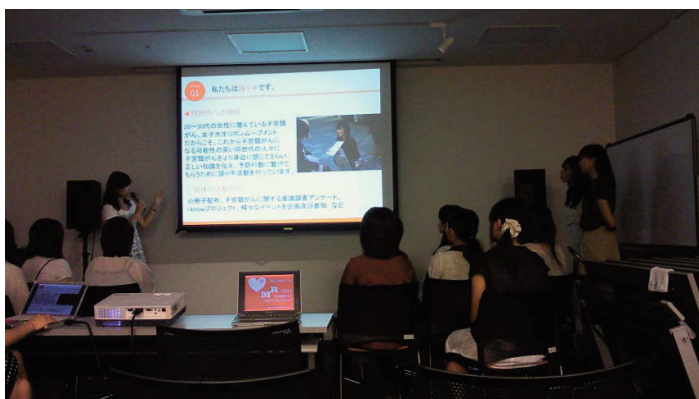
(東京 RM メンバーからの活動紹介)

学校での啓発や、グループワークの方法、アンケート調査の方法など具体的な活動を学んだ。