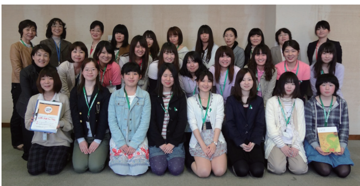
(いなたひめとリボンムーブメントメンバー)