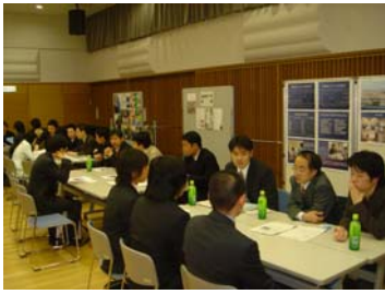
個別説明会の模様