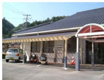
浜田市国民健康保険波佐診療所

医師の偏在などで地域医療が深刻な状態に陥っていますが、地域医療を志す学生や医師は少なくないと思います。波佐診療所が次の世代の医師を育てる場所になるように、日々研鑽したいと思えます。