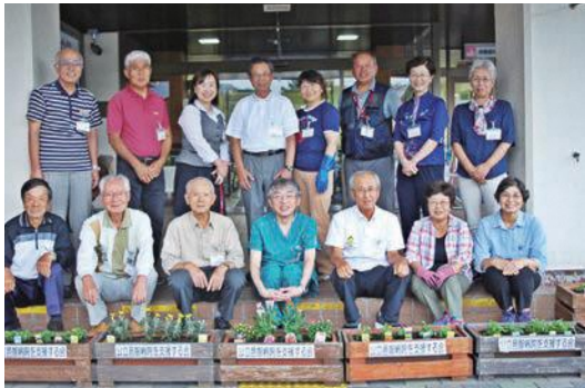
病院玄関前四季の花植え（お花いっぱい運動）

こうした活動により、住民の病気への知識や日頃の健康意識の向上が図られ、病院と住民の絆を強めていると思います。また、高校訪問は医師