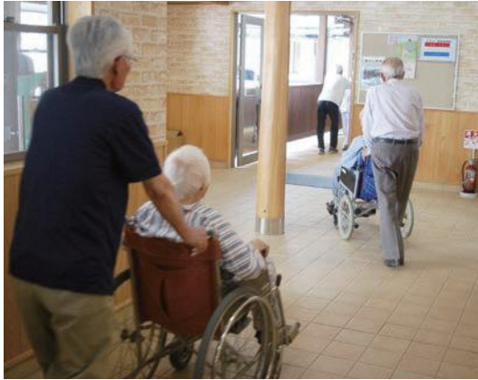
病院ミニコンサート支援（入院患者さんを会場と病室の移送ボランティア）