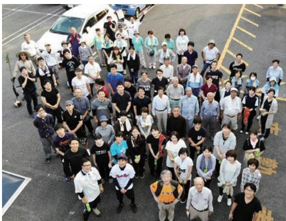
病院職員・支援会協働除草作業

こうした活動により、住民の病気への知識や日頃の健康意識の向上が図られ、病院と住民の絆を強めていると思います。また、高校訪問は医師