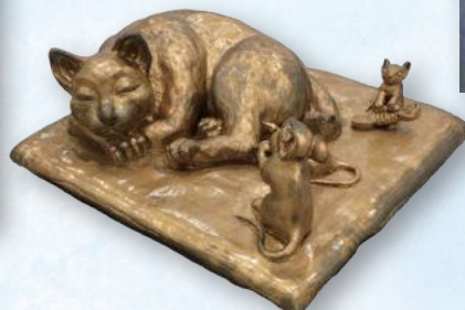
彫刻「油断大敵」佐々木 孝(浜田市)