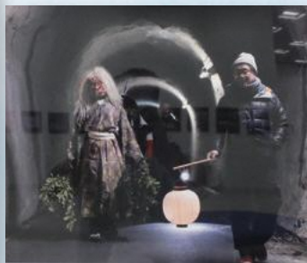
写真「祭りへ」金築 哲(出雲市)