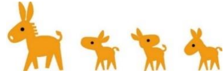
認知症サポーターキャラバン キャラクター「ロバ隊長」

※現地取材を希望される場合は、前日までに上記担当までお知らせいただきますようお願いいたします。