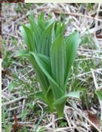
芽出し期 のコバイケイソウ