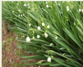
スノーフレーク (スズランスイセン)