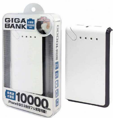
ギガバンク 10000mAh (HAC1078)