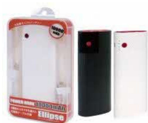
パワーバンクエリプス 10000mAh (HRN-265)