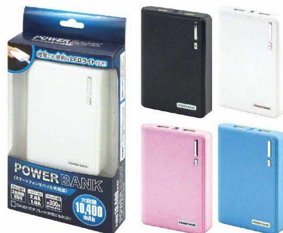
パワーバンク 10400mAh (HAC1182)