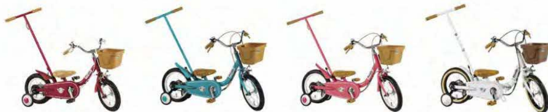
12 インチ スカーレット 14 インチ ブルーミングターコイズ / ブルーミングラズベリー 14 インチプレミアムホワイト