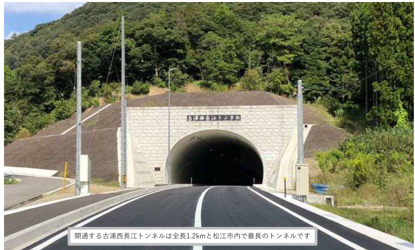
開通する古浦西長江トンネルは全長1.2kmと松江市内で最長のトンネルです