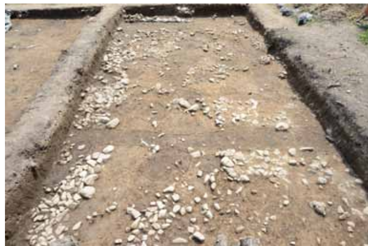
T70西1区石敷き遺構検出状況