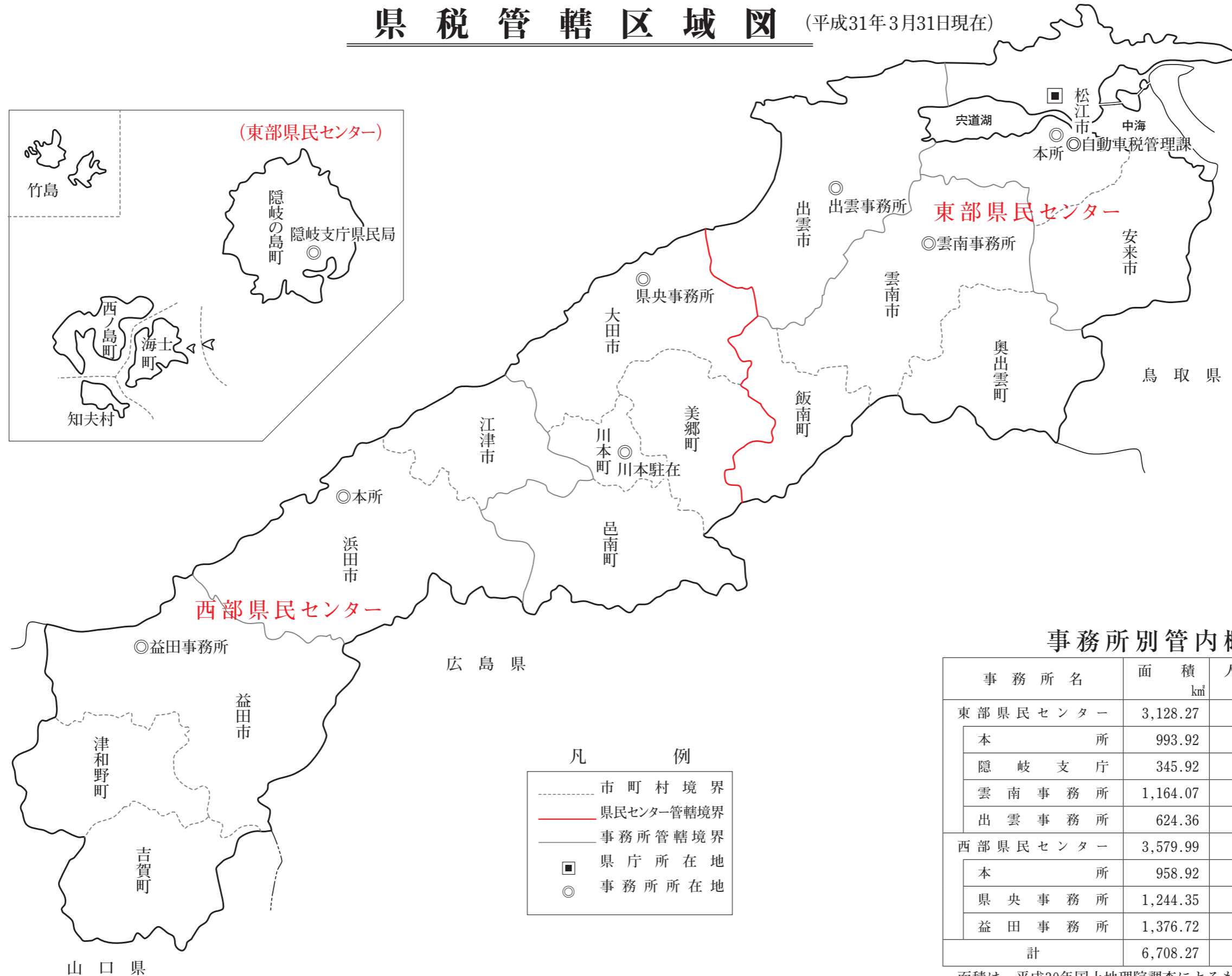
事務所別管内概況