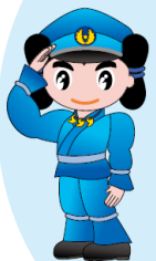
島根県警察 シンボルマスコット みこびーくん