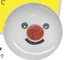
ろすのん 食品ロス削減国民運動ロゴマーク

クイズのヒントや食品ロスについては、各省庁ウェブサイト（下部2次元コード参照）や啓発資材で確認してみましょう。