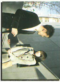
【キヤッチセールス】