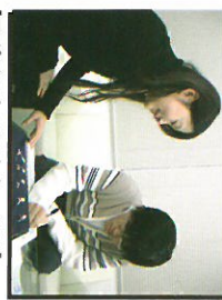
【ポイントメントセールス】