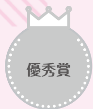
島根県立大田高等学校 2年

個評 犬猿の仲でも分かち合えば分かり合えるというメッセージを、優れた表現力で丁寧に描写しています。桃源郷を彷彿させる背景、色合いもやわらかで、平和な世の中を願っていることが感じられます。諸外国との国同士の関係、ヘイトスピーチなどに現れる民族同士の関係など見る人によって捉え方が変わるような深みのある作品です。