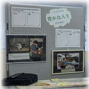
▲昨年の展示の様子