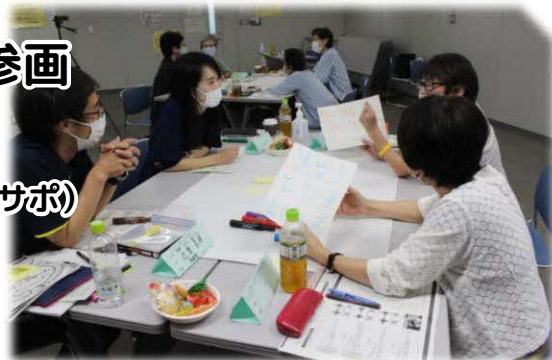
▲アクティブサポーター養成研修の様子

前段の講演を“行動”につなげるために浜田のサポーター2人が進行役となって、今年の研修をふまえた、ワークショップを行います。参加者も進行役も楽しみながら、意見交換・交流できる場づくりを体験しましょう。各地域でも真似できます！