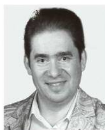
レオニード・ボムステイン (テノール) Леонид Бомштейн

クールにおいて栄冠を勝ちとった。現在、グネーシン記念音楽アカデミーでA.ゴルバチョフに師事しながらロシア国内を中心に積極的な演奏活動を行っている。