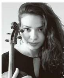
アストヒク・サルダリヤン (ヴァイオリン) Астхик Сардарян

1967年レニングラード(現在のサンクトペテルブルグ)に生まれる。1996年にグネーシン音楽大学を卒業後、スタニスラフスキー&ミネロヴィチ・ダンチェンコ国立モスクワ音楽劇場での活動を経て、1998年ポリショイ劇場のソリストとなる。アイルランド、フランス、ドイツ、アメリカ、スイスを始め、世界中のオペラ音楽祭へ出演し活発な活動を続ける。現在は、演奏活動を続ける傍ら、母校であるグネーシン音楽大学で後進の指導にあたっている。