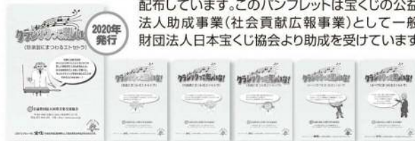
【珍楽器編】 【楽器編】 【作曲家編】 【名曲編】 【オーケストラ編】 【オペラ編】

当協会では、より多くの皆様にクラシック音楽を身近に感じて頂くことを目的に、クラシック音楽に関連する面白い情報を掲載したパンフレットを作成し、日本全国約1,250箇所(音楽ホールや日露交歓コンサート)の会場、当協会のホームページ( http://www.imea.or.jp/ )を通じて広く国民の皆様へ配布しています。このパンフレットは宝くじの公益法人助成事業(社会貢献広報事業)として一般財団法人日本宝くじ協会より助成を受けています。