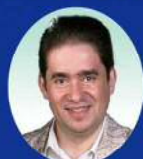
レオニード・ボムステイン Леонид Бомштейн