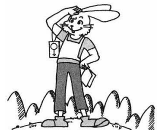
いつもおちついて!