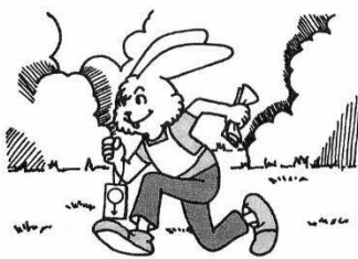
走るだけではだめ!

小雨決行 ☆競技形式 ポイント・オリエンテーリング、ピンパンチ方式 ☆受付時間 13:00~14:00 ☆競技 13:10~15:00（フィニッシュ閉鎖） ☆地図 縮尺 1:10,000 等高線間隔 5m ☆クラス