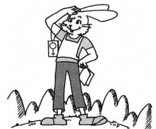
いつもおちついて!