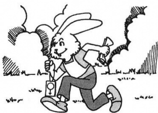
走るだけではだめ!

小雨決行 ☆競技形式 ポイント・オリエンテーリング、ピンパンチ方式 ☆受付時間 13:00~14:00 ☆競技 13:10~15:00（フィニッシュ閉鎖） ☆地図 縮尺 1:10,000 等高線間隔 5m ☆クラス