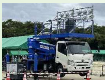
移動照明車 (ソフトボール)