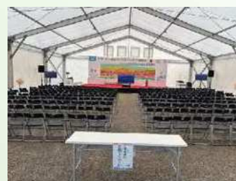
大型仮設テント (ローイング)