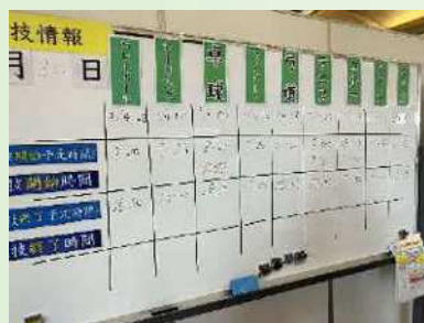
競技開始時間等を管理