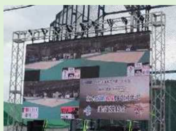
仮設モニター (柔道)