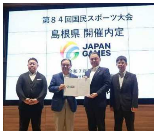
開催内定書受領後・記念撮影