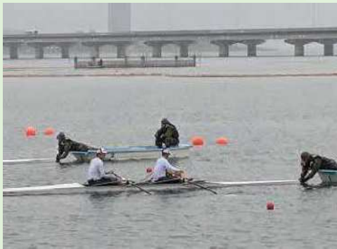
ローイング（発艇補助）