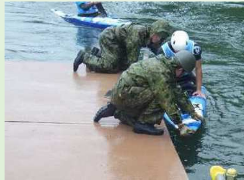
カヌー（艇引き上げ補助）