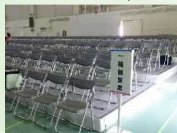
仮設観覧席 (ウエイトリフティング)