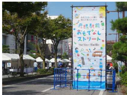
おもてなしストリート