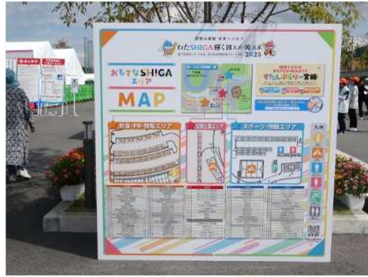
おもてなSHIGAエリア マップ