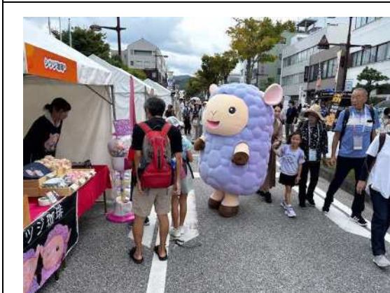
おもてなしストリート