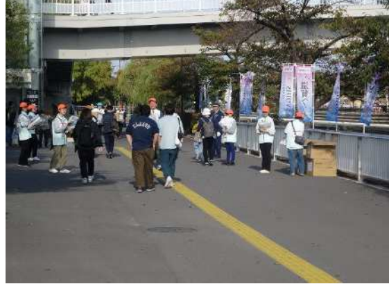
開会式会場付近で来場者へ案内を配布