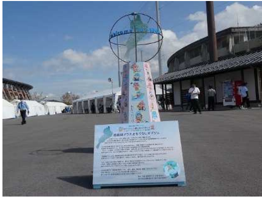
おもてなしオブジェ