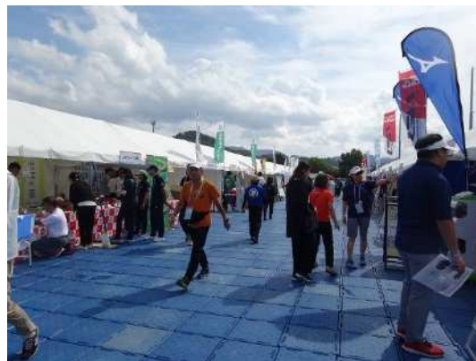
スポーツ・物販ブース