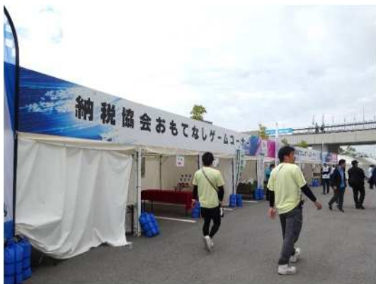
PR・物販ブース おもてなしゲームコーナー