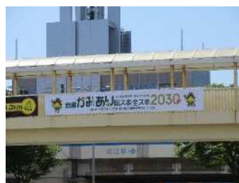
旧一畑百貨店歩道橋