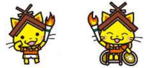
島根県観光キャラクター「しまねっこ」 島根かみあり国スポ・全スポマスコットキャラクター