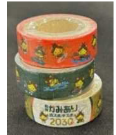
マスキングテープ