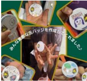
イベント時の 缶バッジ作成