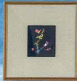
▲筆具：ビーズ 毛糸・刺しゅう糸