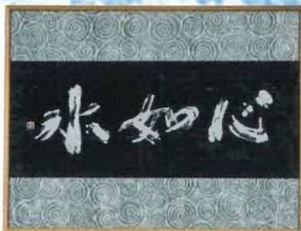
▲筆具：くつ洗ブラシ・白抜剤