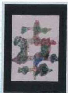
▲筆具：のり・コンテ・クレパス・ビーズ 9歳