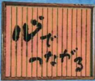
▲筆具：ペーパータオル・墨汁