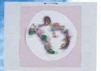
▲筆具：マカロニ・フェルト 13歳