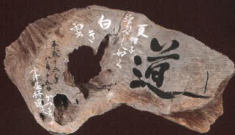
▲筆具：布を丸めて柄をつけた割り箸