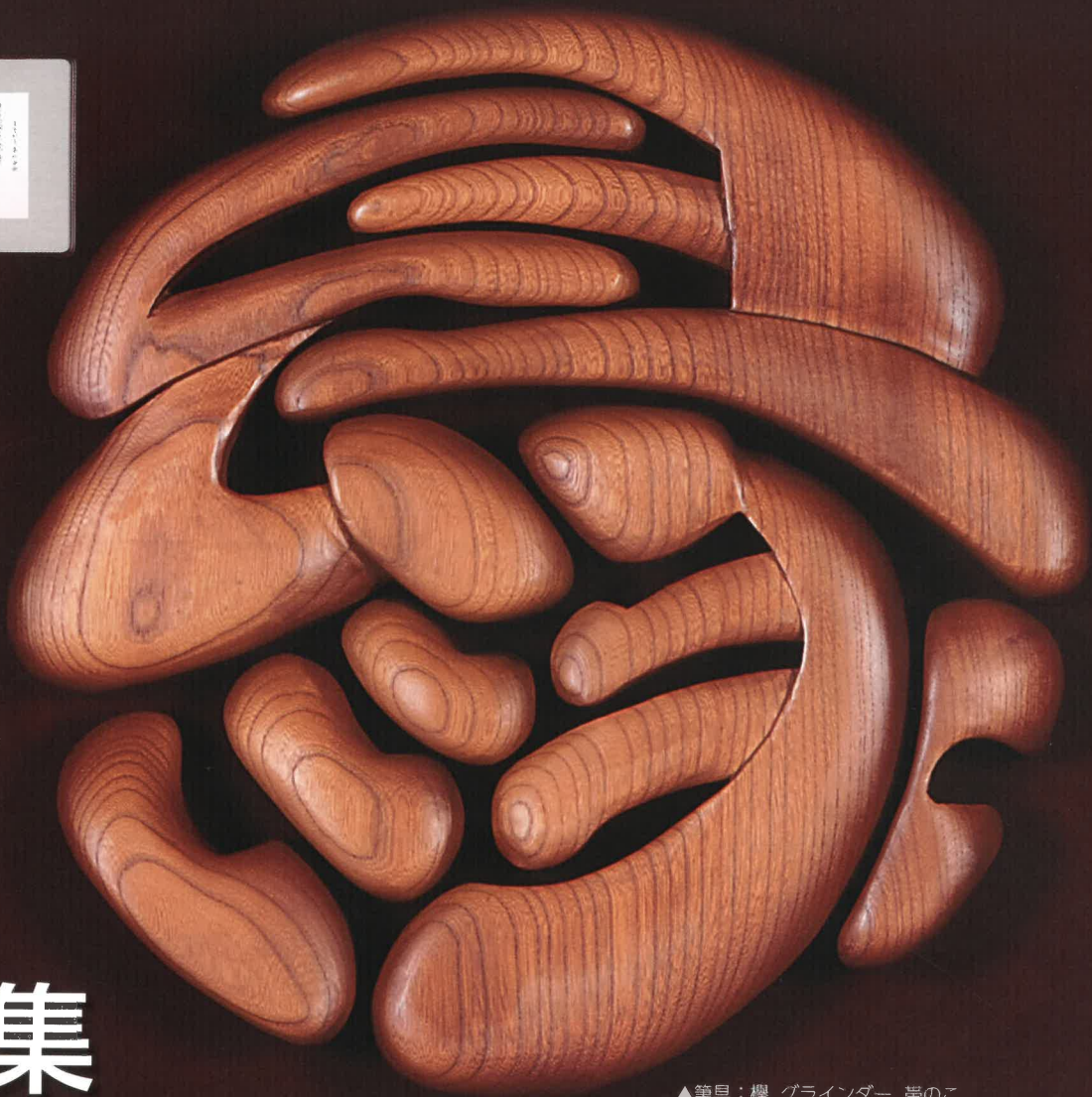
▲筆具：樺 グライNDER 帯のこ