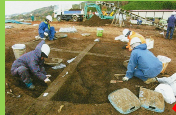
※写真は他遺跡の調査例

③「遺構掘削(いこうくっさく)」 建物跡などの遺構を検出したら、移植ゴテや草削りを使用して慎重に掘り下げます。