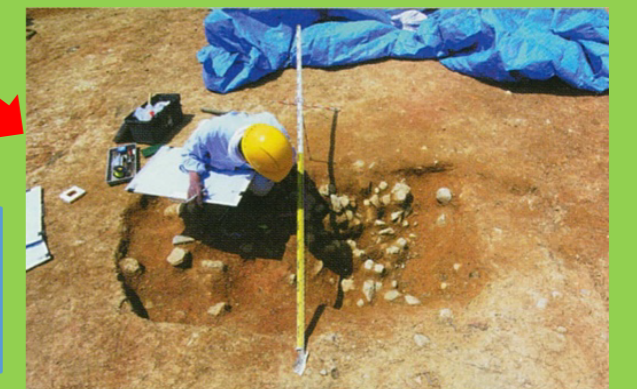
※写真は他遺跡の調査例

③「遺構掘削(いこうくっさく)」 建物跡などの遺構を検出したら、移植ゴテや草削りを使用して慎重に掘り下げます。