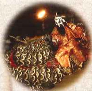
■石見神楽(松田市)【イメージ】