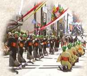
■肥後のうたと踊り(肥後の島)【イメージ】