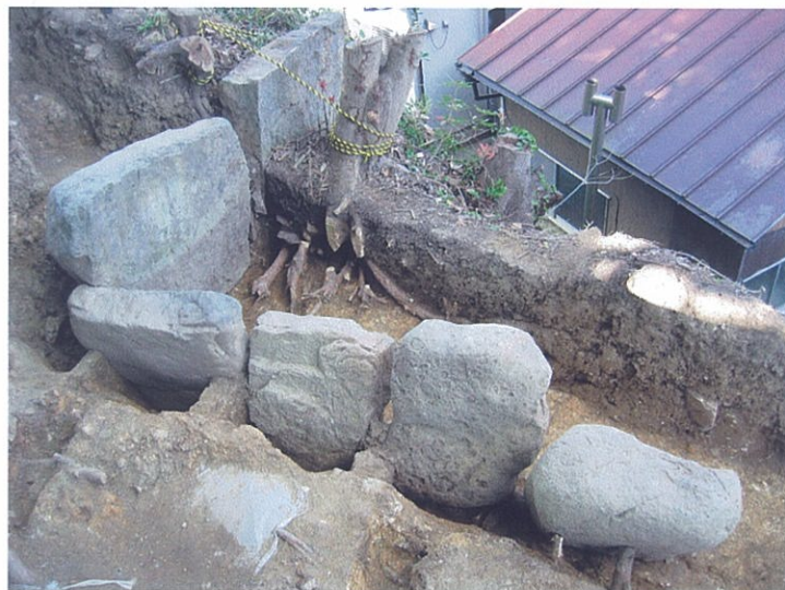
見つかった横穴式石室（基礎石）