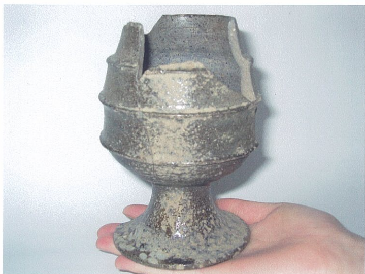
石室から見つかった須恵器（台付椀）

浜田市教育委員会では津摩地区、自然災害防止工事に先立ち、蔵地宅後古墳の調査を実施しています。