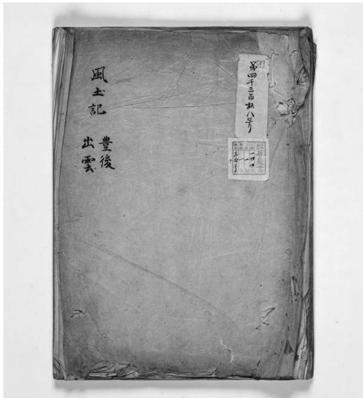
【写真1】勸修寺家本『出雲国風土記』表紙

(2) 高橋周「万葉緯本『出雲国風土記』の系譜とその成立」(『風土記研究』第四一号、二〇一九年)