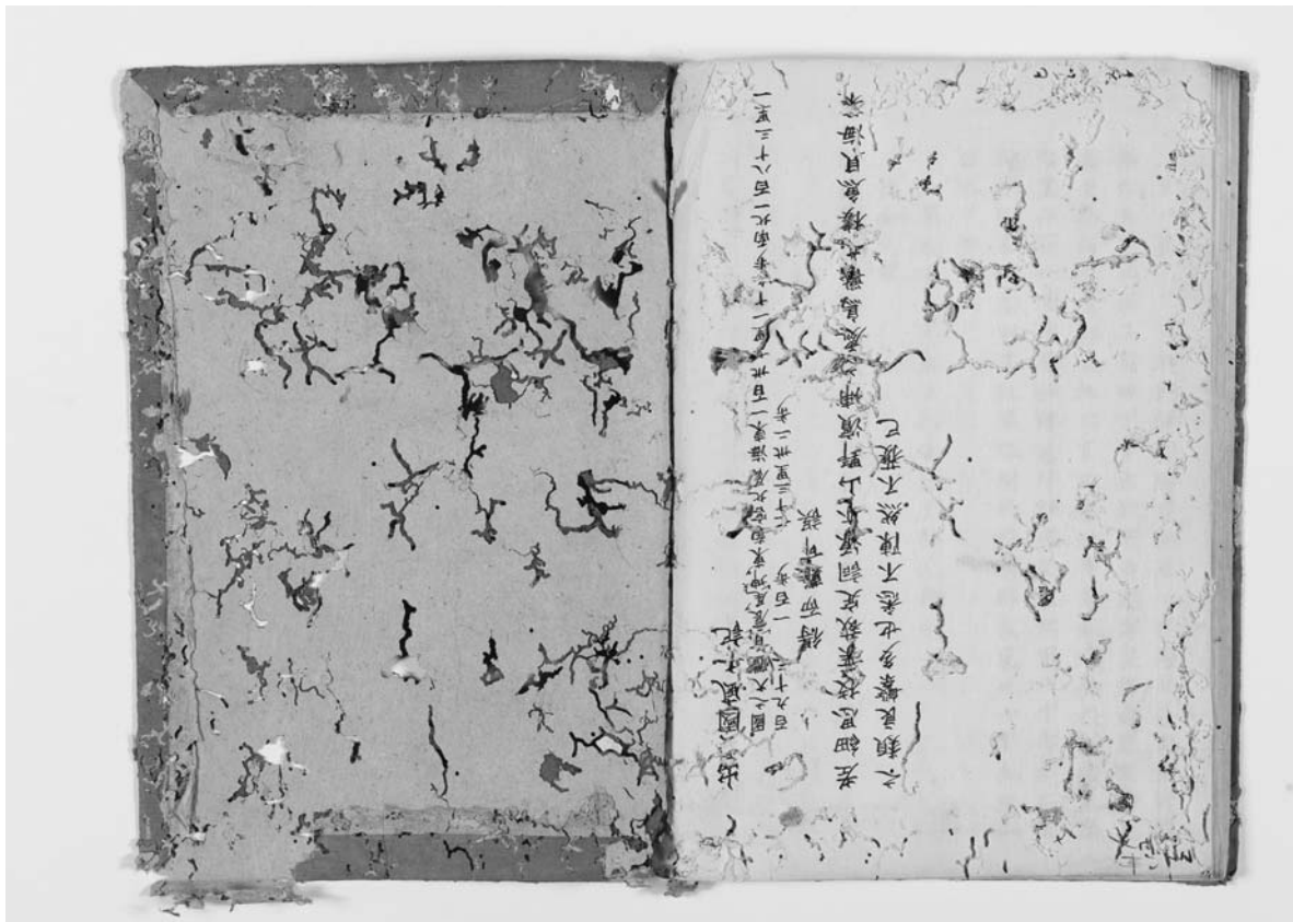
【写真3】出雲弥生の森博物館本『出雲国風土記』後表紙部分