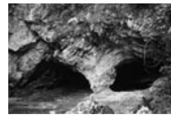
権現山洞窟住居跡