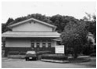
鹿島町立歴史民俗資料館