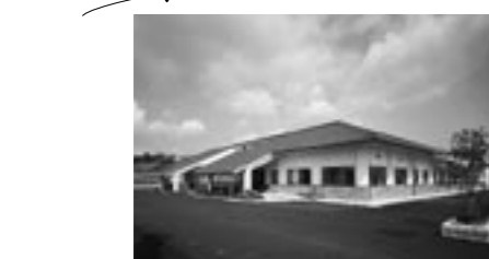
島根県埋蔵文化財調査センター・古代文化センター