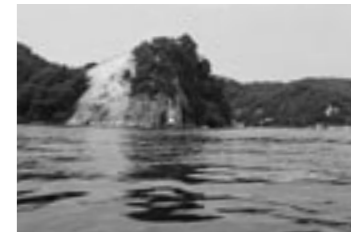
サルガ真洞窟遺跡