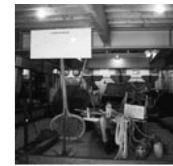
島根町歴史民俗資料館