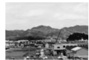
白鹿城跡・真山城跡