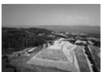
古墳の丘古首志公園