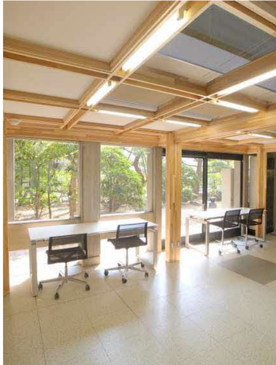
ユニット内部(閲覧スペース)