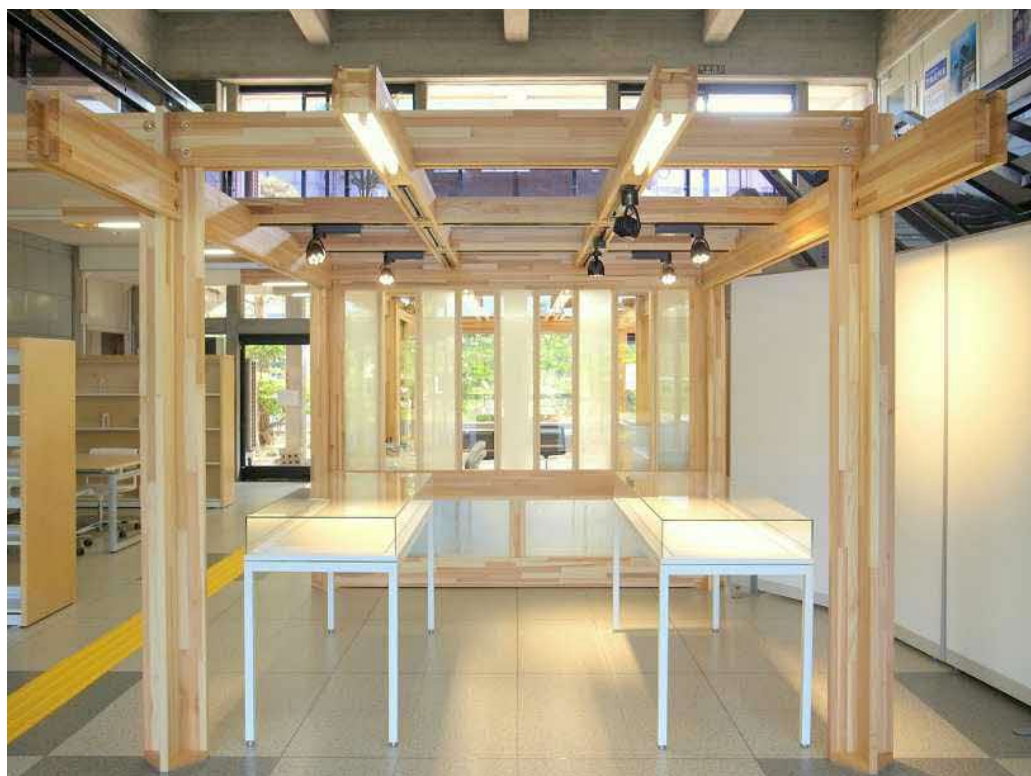
展示スペース(写真正面の半透明ガラスは石州和紙を挟み込んだもの)