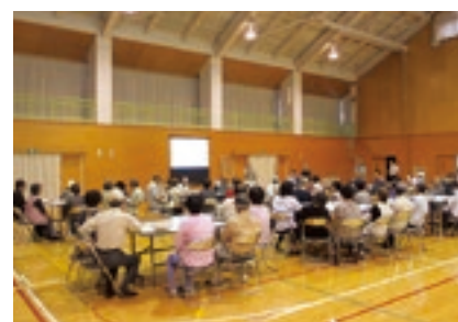
主な活動場所：隠岐郡隠岐の島町大久 活動実施主体：大久地区