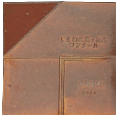
表彰銘板（石州敷瓦）