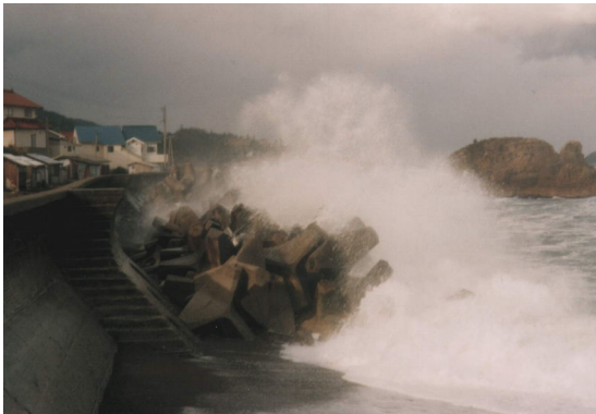
越波の様子（益田市）

基本的に現状の汀線（水際線）を保全・維持することを防護水準とするが、侵食が著しく背後地に被害が生じる可能性が高い場合のほか、砂浜による消波機能を考慮した面的防護を必要とする場合には、汀線の回復を図ることを防護水準とする。