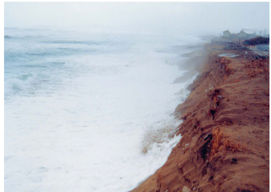
侵食の様子（益田市）