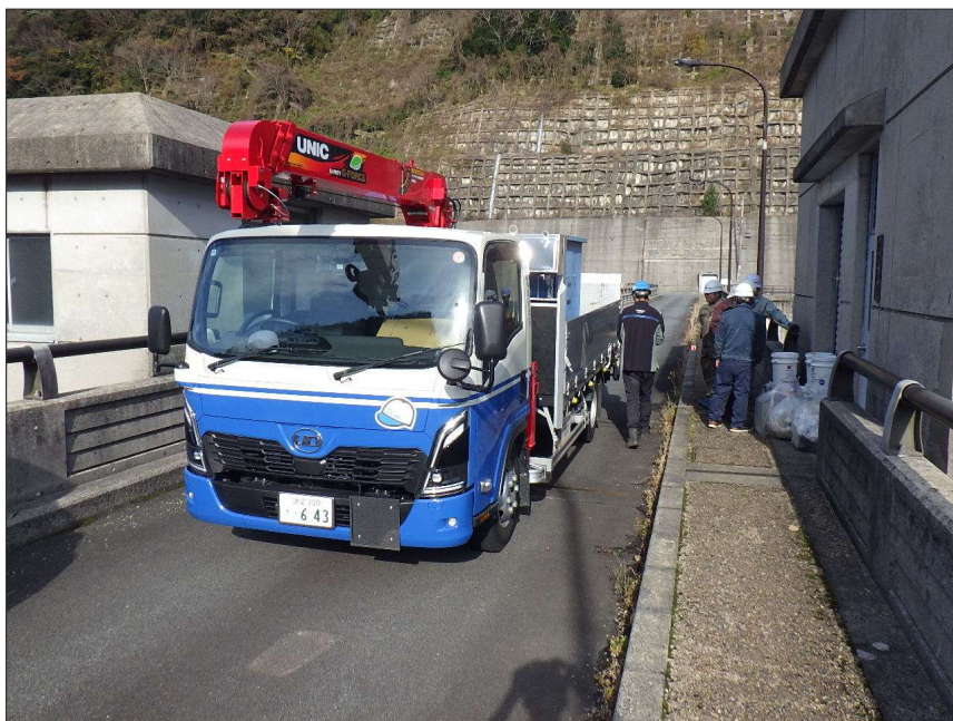
写真区分:使用材料写真 工種:産廃処理状況 写真タイトル:積込状況 撮影箇所:収集運搬車