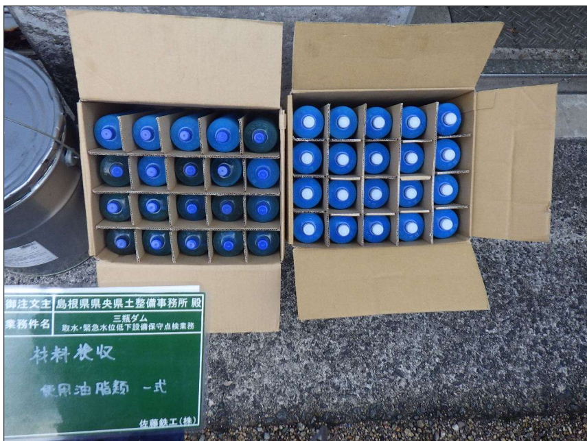
写真区分:使用材料写真 工種:材料検収 写真タイトル:使用材料確認 撮影箇所:MP-0, 2