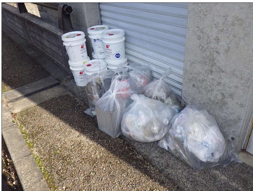
写真区分:使用材料写真 工種:産廃処理状況 写真タイトル:現場集積状況 撮影箇所:現場