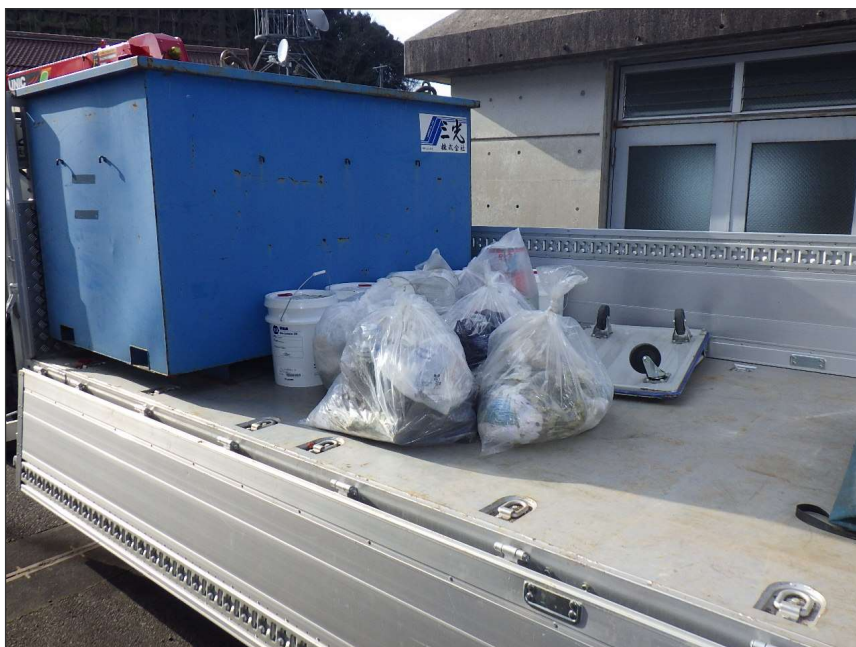
写真区分:使用材料写真 工種:産廃処理状況 写真タイトル:積込完了 撮影箇所:収集運搬車