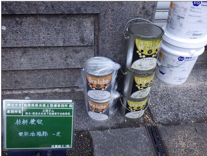
写真区分:使用材料写真 工種:材料検収 写真タイトル:使用材料確認 撮影箇所:オアグループ G1650