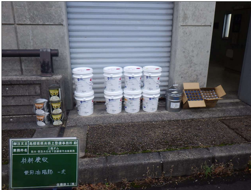
写真区分:使用材料写真 工種:材料検収 写真タイトル:使用材料確認 撮影箇所:使用油脂類一式