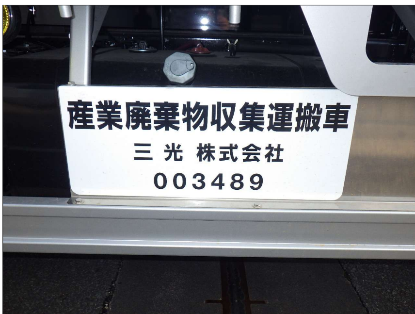
写真区分:使用材料写真 工種:産廃処理状況 写真タイトル:許可番号 撮影箇所:収集運搬車