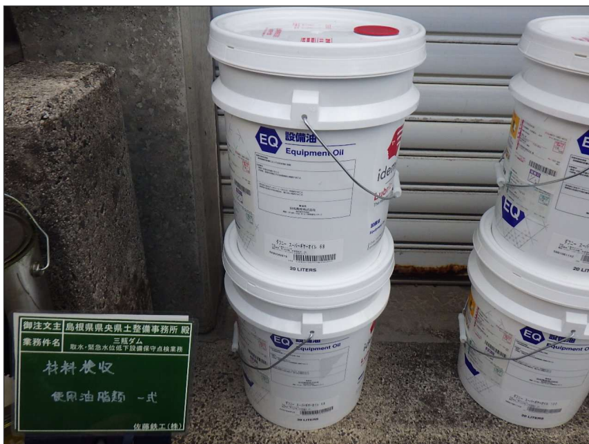
写真区分:使用材料写真 工種:材料検収 写真タイトル:使用材料確認 撮影箇所:ダフニー スーパーギヤオイル68