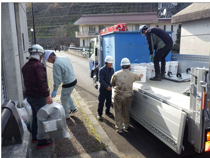
写真区分:使用材料写真 工種:産廃処理状況 写真タイトル:積込状況 撮影箇所:収集運搬車