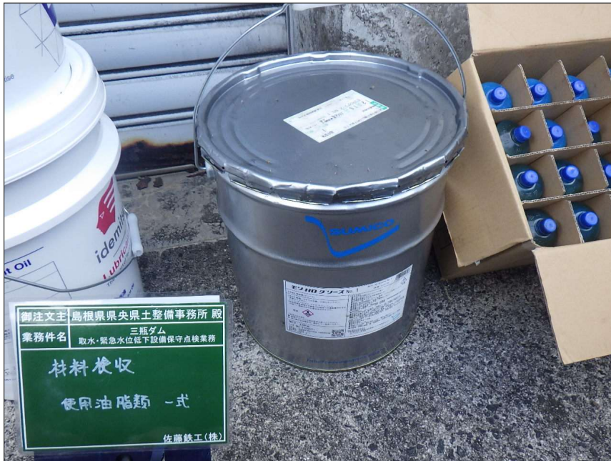
写真区分:使用材料写真 工種:材料検収 写真タイトル:使用材料確認 撮影箇所:モリ GG-S