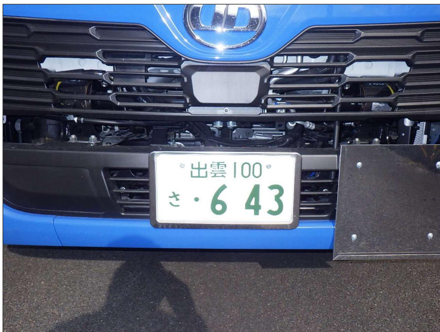
写真区分:使用材料写真 工種:産廃処理状況 写真タイトル:許可番号 撮影箇所:収集運搬車