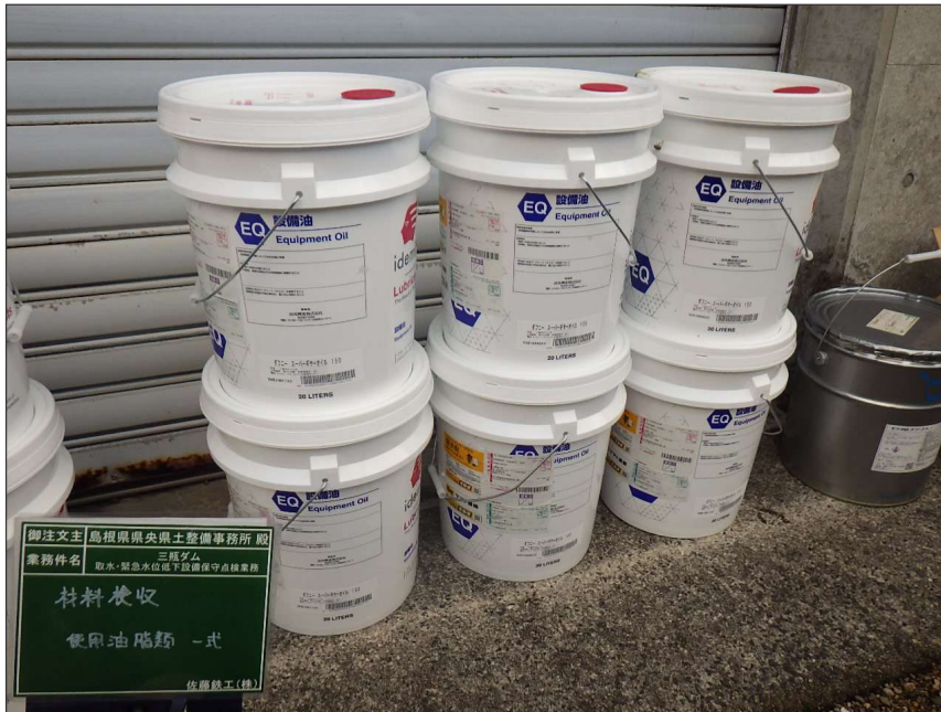
写真区分:使用材料写真 工種:材料検収 写真タイトル:使用材料確認 撮影箇所:ダフニー スーパーギヤオイル150