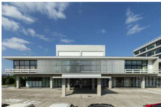
島根県庁舎議事堂（安田臣）S34年