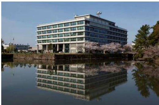
島根県庁舎本庁舎（安田臣）S34年