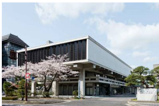
旧島根県立博物館（菊竹清訓）S33年