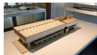
旧県立博物館模型