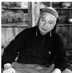
第23代田部長右衛門