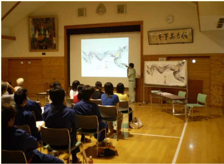
朝山コミュニティーセンターで事業説明

その後、改修の行われた現地へ移動し、堤防や橋梁、樋門などの改修状況について説明しました。