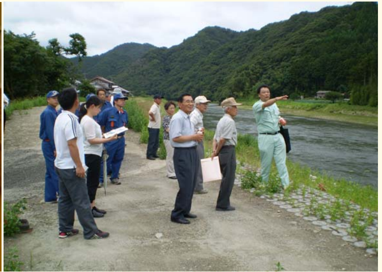
現地で改修状況の説明