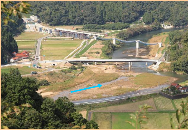
現況写真 (奥の工事中の橋梁は高速道路)