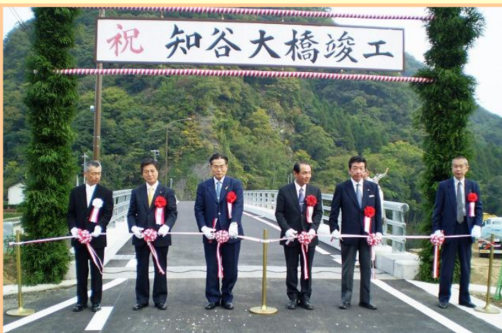
地元代表や工事関係者によるテープカット