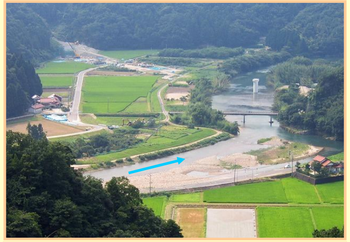
橋梁及び河川の改修前