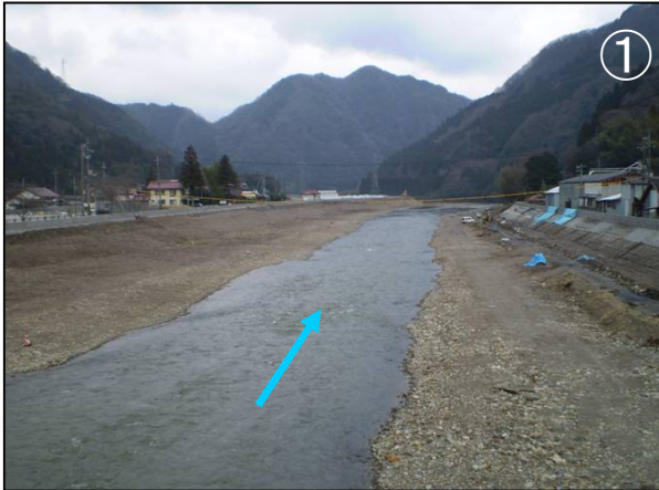
乙立橋下流パラペット完成状況

乙立橋より下流部のパラペットが完成しました。 現在は、わかあゆの里築堤護岸工、後谷川樋門下部工、乙立橋下流右岸法枠工、乙立橋上流パラペット工および築堤護岸工を連日の悪天候にもかかわらず急ピッチで作業を進めています。 工事の進捗率は約50%です。 樋門のゲートも工場で順調に製作されています。