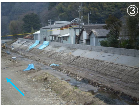
乙立橋下流部法枠施工状況