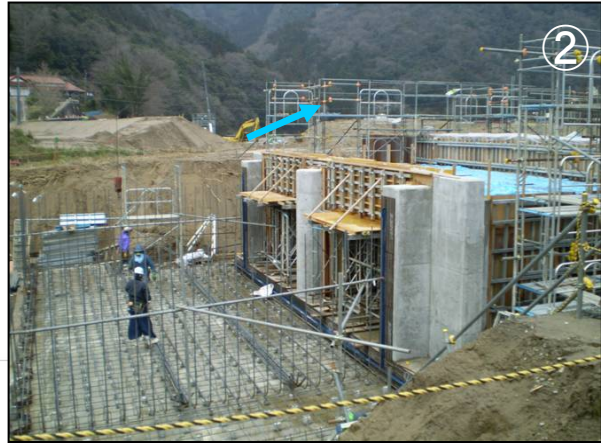
樋門下部工施工状況