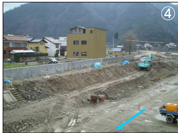
乙立橋上流部パラペット施工状況