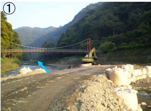
浮嵐橋付近掘削状況