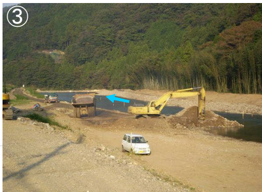
立久恵改善センター付近掘削状況