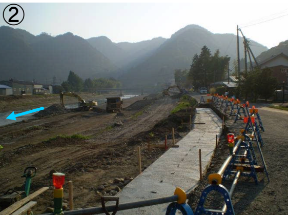
乙立小学校付近パラペット施工状況