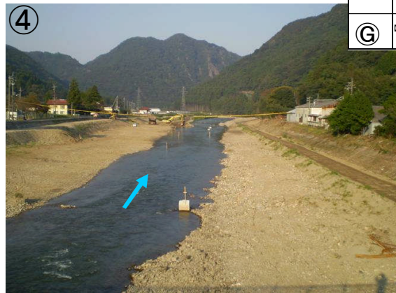
乙立小学校付近掘削状況