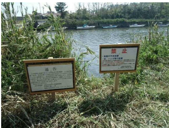
【撤去後現地掲示状況】