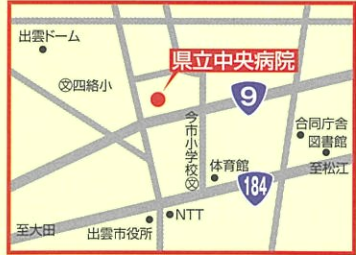
1 島根県立中央病院 姫原4-1-1 ☎(0853) 22-5111