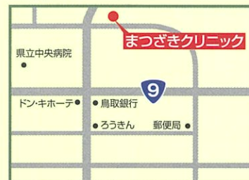
10 まつざきクリニック 姫原4-10-2 ☎(0853) 31-7700