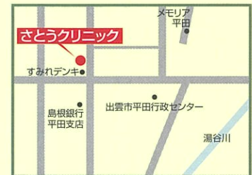
13 さとうクリニック 平田町989-1 ☎(0853) 62-4311