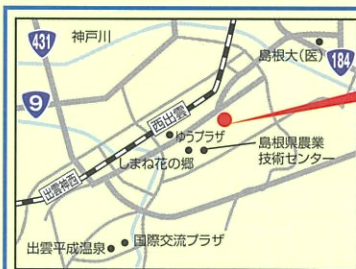
4 島根県立こころの医療センター 下古志町1574-4 ☎(0853) 30-0556