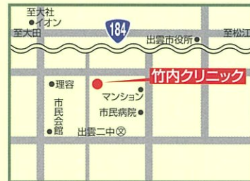
9 竹内クリニック 塩治町1466-1 ☎(0853) 23-8686