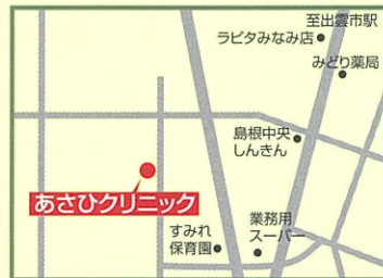
6 あさひクリニック 塩治町950-2 ☎(0853) 20-1058