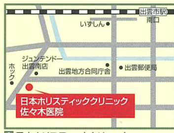
8 日本ホリスティッククリニック 佐々木病院 塩治善行町14-1 ☎(0853) 25-1311