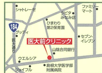
12 医大前クリニック 塩治神前1-7-7 ☎(0853) 31-8880