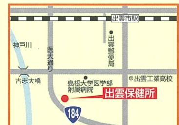
14 出雲保健所 塩治町223-1 ☎(0853) 21-1653

【出雲市】こころの健康相談 (予約制・無料) 毎月、出雲市役所各行政センター(平田・佐田・多伎・湖陵・大社・斐川)で実施 日程や予約先は市のホームページ等でご確認ください。 問い合わせ先 出雲市役所 健康増進課 ☎(0853) 21-6976