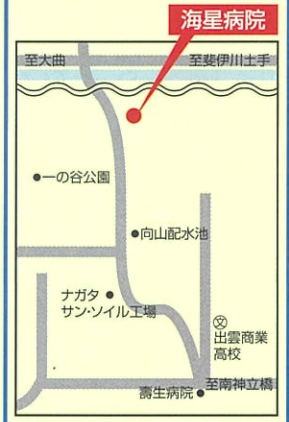
5 海星病院 大津町3656-1 ☎(0853) 21-3521