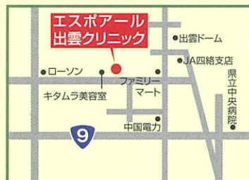
7 エスポール出雲クリニック 小山町361-2 ☎(0853) 21-9779