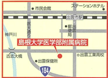
2 島根大学医学部附属病院 塩治町89-1 ☎(0853) 20-2388