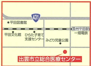
3 出雲市立総合医療センター 灘分町613 ☎(0853) 63-5111