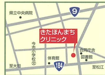
11 きたほんまちクリニック 今市町北本町5-3-6 ☎(0853) 25-7582